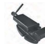
Etau EP 100 BF